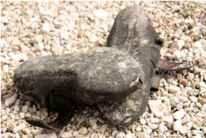
Lezečky po výstupu na Cima Grande.