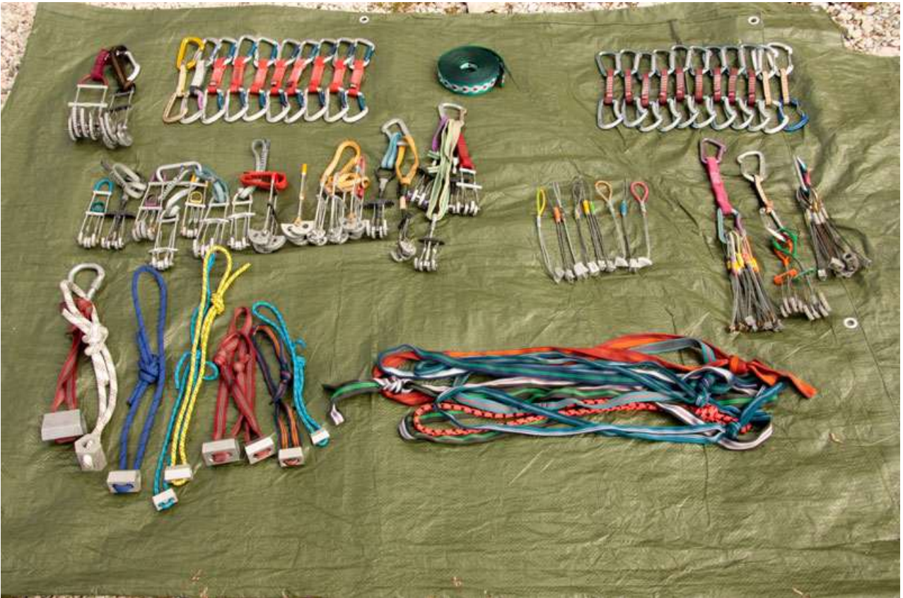
Přehledka horolezeckého „matroše“. Vlevo nahoře friendy, směrem doprava expresní karabiny neboli expresky, v druhé řadě opět friendy, pokračují vklíněnce, friendy a hexy, v dolní řadě potom velké hexy a nakonec vpravo dole smyčky.