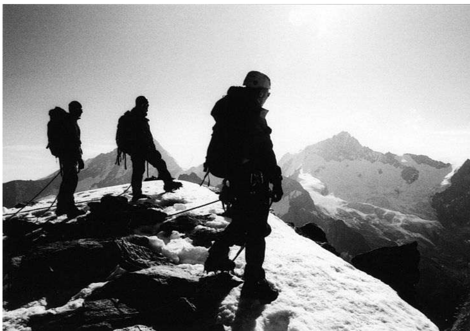
Pohled z hřebene směrem na Weisshorn (4506m) a Zinalrothorn (4221m). Cesta na Zinalrothorn vypadá velmi strmě až hrozivě.